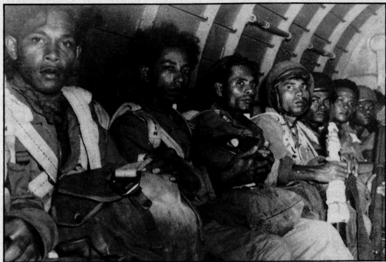
Para's van het Korps Speciale Troepen, gereed voor een dropping tijdens de Tweede Politie Actie

In reactie op de bijdrage van De Moor werd door een toehoorder, die zelf bij de acties in Zuid-Celebes betrokken was geweest, op een bewogen wijze uiteengezet onder welke schrijnende omstandigheden het KNIL in Zuid-Celebes destijds moest optreden. Vele KNIL-militairen, aldus spreker, hadden in Japanse krijgsgevangenschap gezeten en werden vrijwel meteen daarna ingezet in de