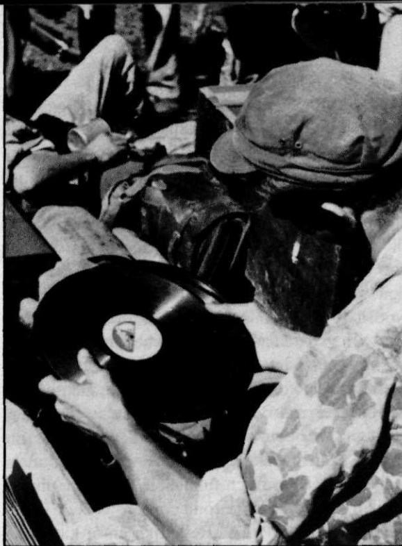
De door de Niwin verstrekte grammofonplaten worden ingepakt en zullen ook in het nieuwe kampement voor vertier zorgen

In tegenstelling tot de politieke en economische aspecten van het Nederlandse militaire optreden is, zo stelde mevrouw drs. Groen in haar bijdrage, het militaire beleid nog steeds grotendeels een „terra incognita”. In een goed onderbouwd betoog zette zij de verschillende, door de Nederlands-Indische militaire autoriteiten tussen april en september 1947 naar voren gebrachte, strategi-