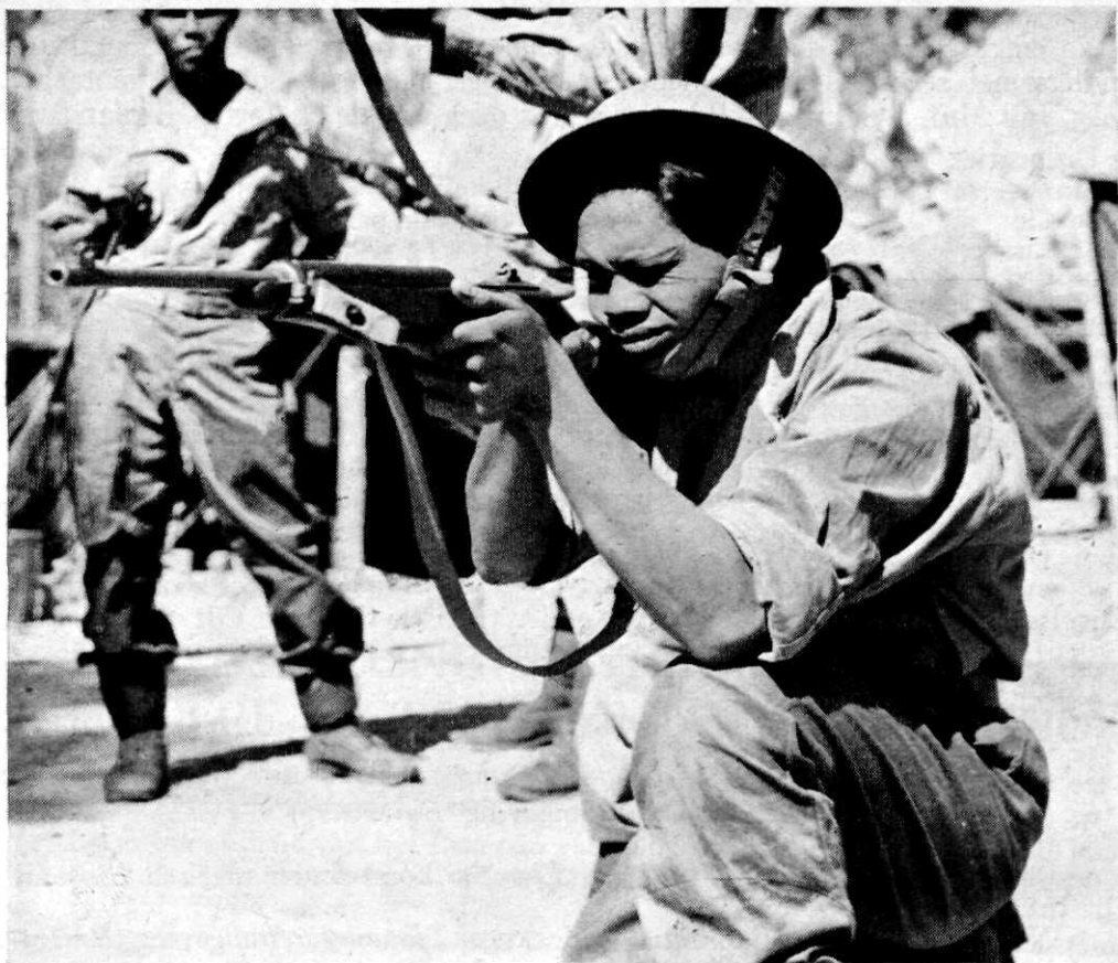
Een inheemsche korporaal van 5—1 Bat. Inf. bewapend met de u. b. jungle carbine.

27 Juni : Actie van de 6e Cie tegen vij. te Pasar Angin (omgeving Padalarang ).